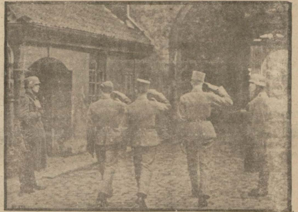
Acı bir esaret levhası: Danimarkada zabıt ve askerler Alman askerlerine selâm vermek mecburiyetine tutulmuştur. Resim bu sahneyi göstermektedir Londra 4 (Husul) — İtalyanın harici-Telegrafo», İngiliz kuvvetlerinin cenu- ye nazırı Kont Cianonun gazetesi olan (Devamı 3 üncü sayfada)

Kont Cianonun gazetesi: «Norveçte harb henüz bitmemiştir,, diyor