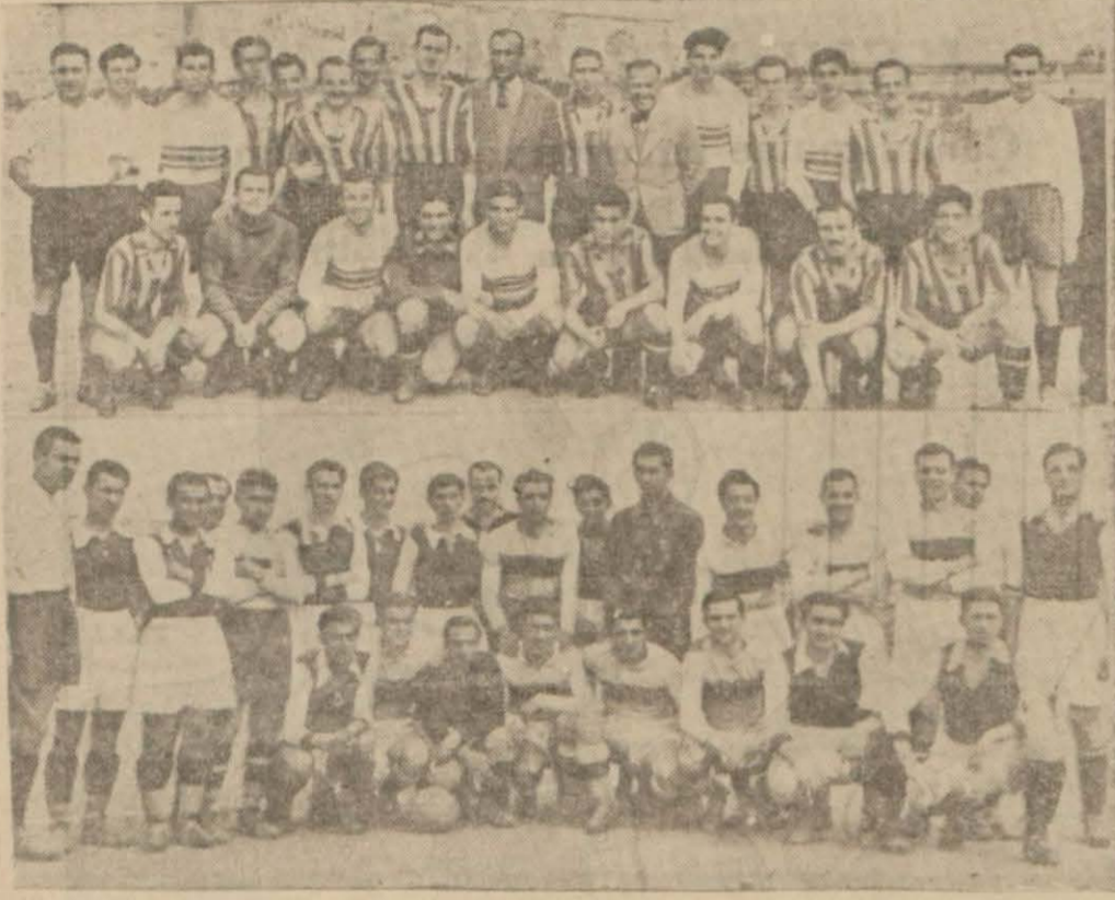
Yukarıda Galatasaray - Boğaziçi, altta Hayriye - Haydarpaşa mekteb takımları

Mektepler arası futbol şampiyonunu meydana çıkaracak olan Galatasaray - Boğaziçi maçı dün yapıldı, beraberlikle neticelendi Demirspor Beyoğluspora yenildi