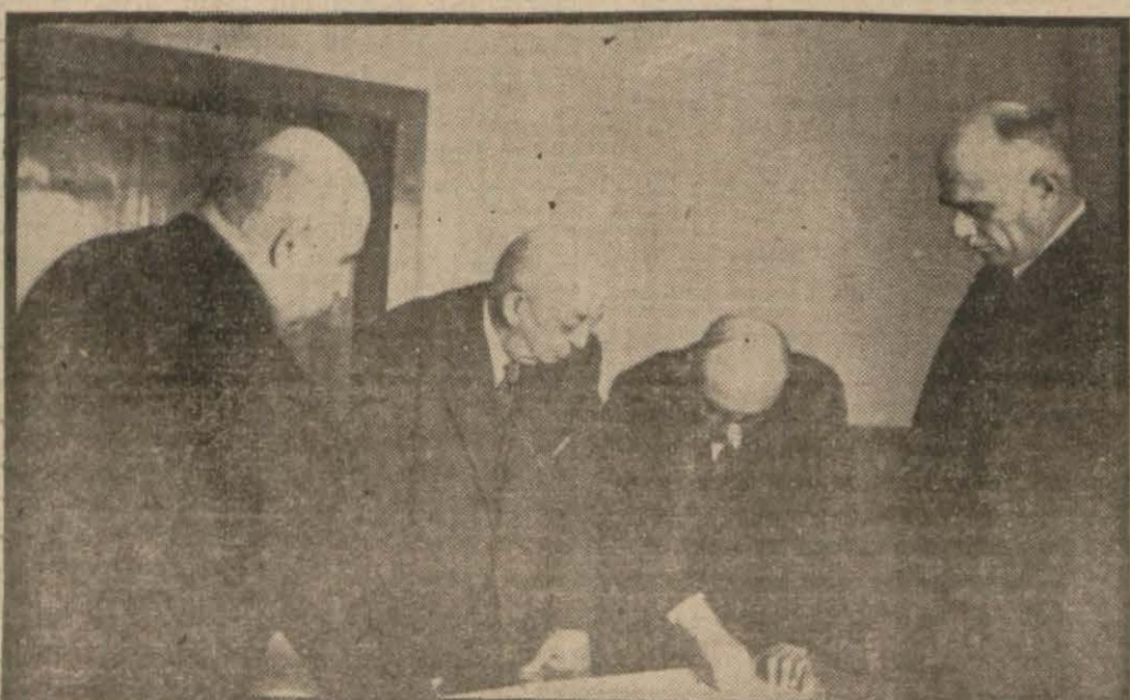
Başvekil Diyarbakırda imar plânı hakkında verilen izahatı dinlerken (Yazısı 3 üncü sayfada)